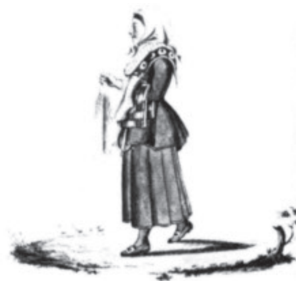
Denne bondekona frå Rogaland er ein akvarell av J. F. L. Dreier frå kring 1810. Typisk nok held ho handteinen i hendene. Sjølv når ein gjekk, burde ein ha noko å gjera.

han enn kvinnene. Og det sjølv om bonden oftast var eit par: husbonde og husfrue. Den eine greidde seg ikkje lenge utan den andre.