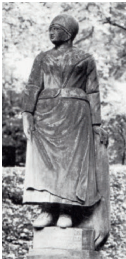
Denne statuen står i Nordmandsdalen på Sjælland og framstiller ei fiskarkone frå Karmøy. Konen, klædt i en meget tarvelig Dragt, heldene op til en Klippe, staaer ligesom i Forventning ad hendes Mands Komme frå Søen, heiter det i teksten til denne statuen, som er frå kring 1760.

I Gulatingslova var det påbod til bøndene om å brygga øl til jul. Sist på 1700-talet laut det brennevin til, og endå meir frå napoleonskrigane då poteta for alvor gjorde sin innmarsj. Frå 1816 var det også lov å driva heimebrenning,