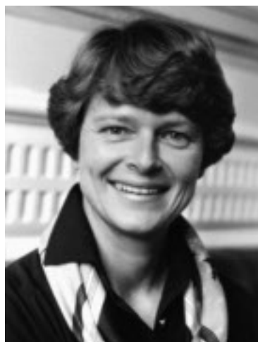
Gro Harlem Brundtland kom inn som et friskt pust i norsk politikk som miljøvernminister i 1974 og som nestleder i Arbeiderpartiet i 1975. Det ble fart i barnehageutbyggingen, og det ble lagt til rette for kvinnes inntog i arbeidslivet. Gro ble verdensberømt for sin kvinne-regjering i 1986.

Utdanningssektoren ble bygd ut. Alle fikk rett til