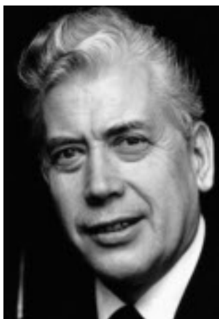
Da Tor Halvorsen gikk ut av regjeringen - for i 1977 å bli valgt til leder i LO - var en mer rettferdig sykelønnsordning noe av det han prioriterte aller høyest. Den gang var det offentlig ansatte og funksjonærer i det private som hadde en slik ordning. De som hadde større risiko for å bli skadet eller syke, hadde det ikke.