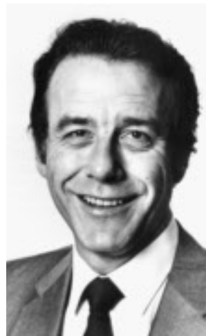
Reiulf Steen ble kjent som skolepolitiker gjennom sin ledelse av Steen-komiteen som foreslå rett til 3 års videregående utdanning for alle. Et kjempemessig steg for utjamning i mulighetene til utdanning. Han kunne den gang ikke bli statsråd i Kirke- og undervisningsdepartementet fordi han ikke var medlem av statskirken.

Det ble lagt opp til en ny kulturpolitikk, og bevilgningene til formålet økte betydelig. Miljøpolitikken fikk et gjennombrudd. Bevisstheten økte. Det kom nytt lovverk og ulike økonomiske ordninger som bygde opp under den nye politikken som ble satt i verk.