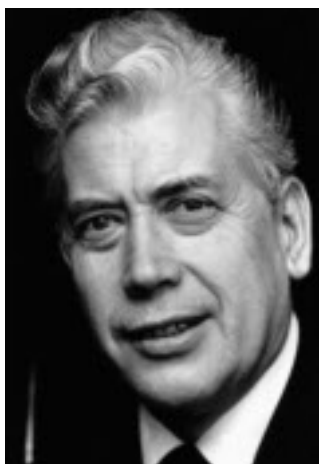
Da Tor Halvorsen gikk ut av regjeringen - for i 1977 å bli valgt til leder i LO - var en mer rettferdig sykelønnsordning noe av det han prioriterte aller høyest. Den gang var det offentlig ansatte og funksjonærer i det private som hadde en slik ordning. De som hadde større risiko for å bli skadet eller syke, hadde det ikke.