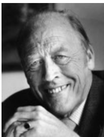
Odvar Nordli - statsminister siste halvdel av 1970-tallet. På tross av mange tunge tak på det økonomiske området gjorde han et brakvalg i 1977. Sentral i utformingen av partiets regionalpolitikk tidligere på 1970-tallet - bl.a. som kommunalminister.

Videre fikk vi endringer i pristakstsystemet for boliger. Beregningsgrunnlaget ble skrevet opp fra «historisk kostpris» til dagens byggekostnader. Det gikk som det måtte gå, pristakstene nærmest eksploderte. En rekke boliger ble fritatt fra takseringsplikt, og slik at boligkooperasjonen kom i en håpløs, klemt posisjon. Det viste seg snart at det ikke var mulig å opprettholde prisreguleringen bare for en type boliger.