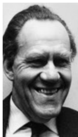
Olav Gjærevoll ble verdens første miljøvernminister. Tidligere hadde han vært sosialminister. Som professor i botanikk hadde han også spesielle faglige forutsetninger for å dekke dette feltet.

Selv om det generelt sett stod godt til i Norge og norsk økonomi ved inngangen til 1980-tallet, betyr ikke det at det ikke var behov for endringer. Det ville ha skjedd også med en fortsatt Arbeiderparti-regjering. Også på det boligpolitiske feltet var det behov for enkelte tilpasninger. Men det er forskjell på å barbere seg og å skjære haka av seg. Den rasing Willoch la opp til, kan da heller ikke begrunnes i konkrete praktiske behov for endringer, men var