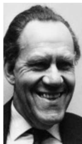
Olav Gjærevoll ble verdens første miljøvernminister. Tidligere hadde han vært sosialminister. Som professor i botanikk hadde han også spesielle faglige forutsetninger for å dekke dette feltet.

Selv om det generelt sett stod godt til i Norge og norsk økonomi ved inngangen til 1980-tallet, betyr ikke det at det ikke var behov for endringer. Det ville ha skjedd også med en fortsatt Arbeiderparti-regjering. Også på det boligpolitiske feltet var det behov for enkelte tilpasninger. Men det er forskjell på å barbere seg og å skjære haka av seg. Den rasering Willoch la opp til, kan da heller ikke begrunnes i konkrete praktiske behov for endringer, men var