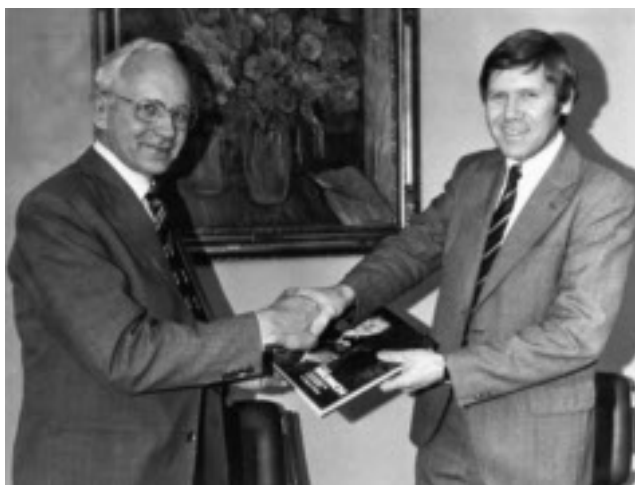
To sentrale aktører i det inntektspolitiske samarbeidet på 1970-tallet - finansminister Per Kleppe til venstre og lederen av Stortingets finanskomite Gunnar Berge til høyre.

messig ble virksomheten integrert i samfunnet slik at den er kommet hele befolkningen til gode. Gjennom oppbygging av lov- og regelverk, forvaltnings- og kontrollordninger og etablering av et eget statsoljeselskap ble virksomheten underlagt samfunnsmessig styring og kontroll. (Jeg viser i denne sammenheng til min artikkel i fjorårets historieårbok «Da olja kom til byen og Rosenberg».)