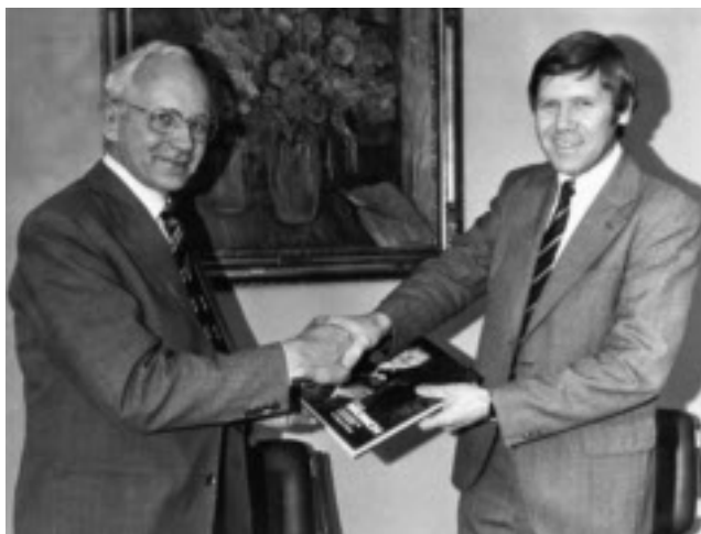
To sentrale aktører i det inntektspolitiske samarbeidet på 1970-tallet - finansminister Per Kleppe til venstre og lederen av Stortingets finanskomite Gunnar Berge til høyre.

messig ble virksomheten integrert i samfunnet slik at den er kommet hele befolkningen til gode. Gjennom oppbygging av lov- og regelverk, forvaltnings- og kontrollordninger og etablering av et eget statsoljeselskap ble virksomheten underlagt samfunnsmessig styring og kontroll. (Jeg viser i denne sammenheng til min artikkel i fjorårets historie-årbok «Da olja kom til byen og Rosenberg».)