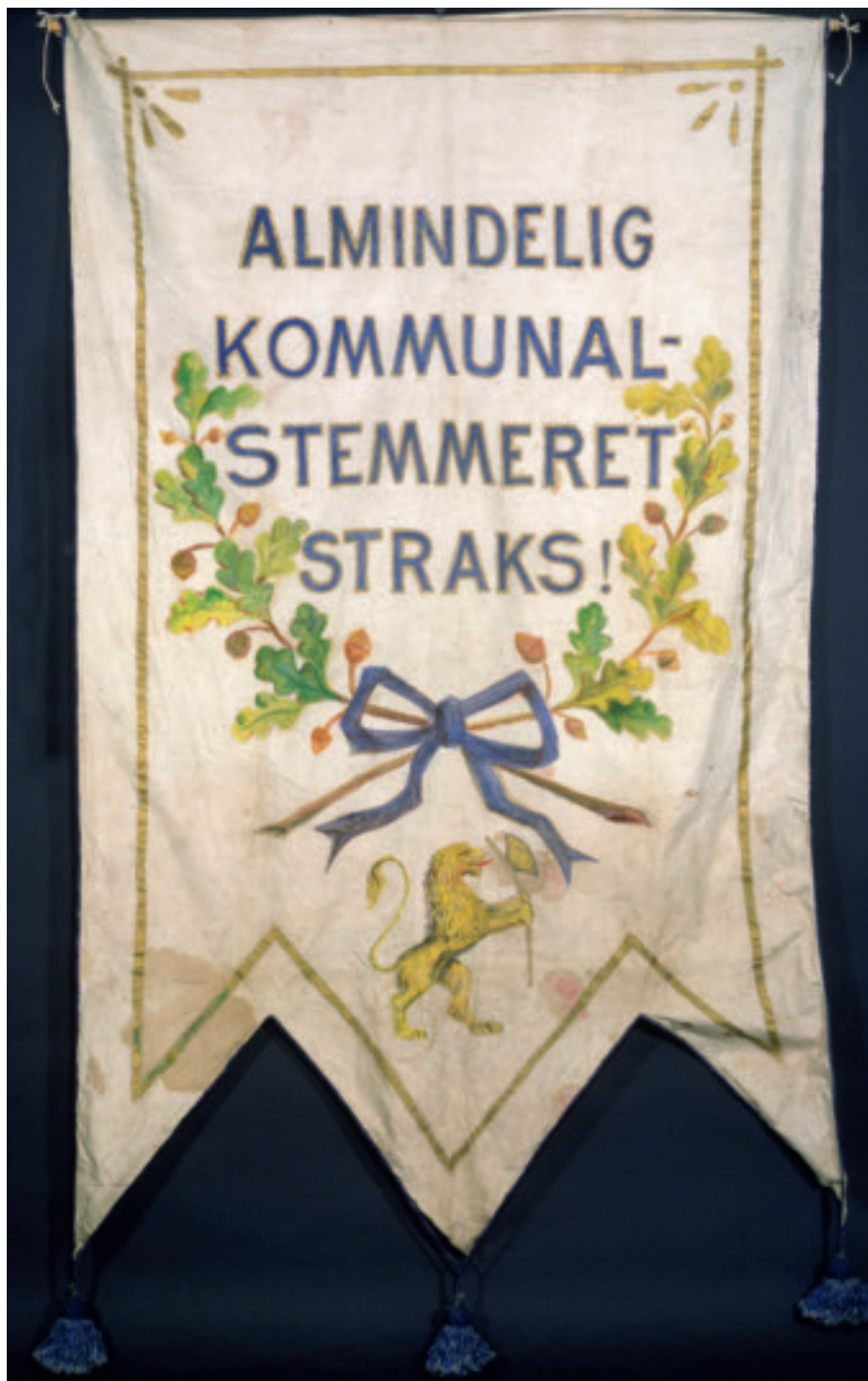
Arbeiderbevegelsen kjempet tidlig for allminnelig kommunal stemmerett. Fanen eies av Arbeidernes Historielag i Rogaland