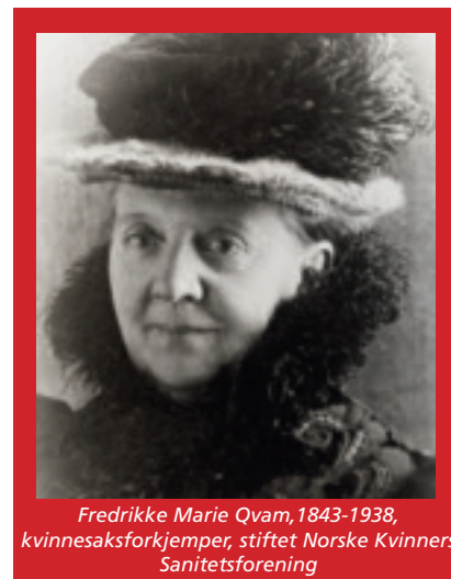
Fredrikke Marie Qvam, 1843-1938, kvinnesaksforkjemper, stiftet Norske Kvinners Sanitetsforening

Det var altså både politiske og sosiale forhold som fikk flere og flere kvinner med på kravet om at kvinner måtte ha de samme rettighetene som mennene.