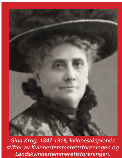
Gina Krog, 1847-1916, kvinnesaks pionér, stifter av Kvinnestemmerettsforeningen og Landskvinnestemmerettsforeningen.