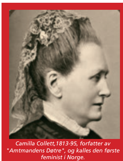
Camilla Collett, 1813-95, forfatter av "Amtmandens Døtre", og kalles den første feminist i Norge.