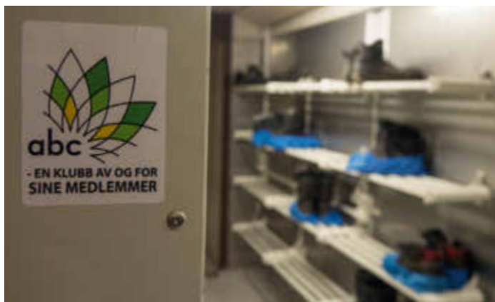
ABC kjempet en vanskelig kamp for sine medlemmer.

og de var langt flere. Arbeidstakerorganisasjoner hadde rett til å bruke streik og andre kampmidler for å tvinge arbeidsgiverne til å inngå avtale, men det stilte store krav til samhold og styrke. Men OFS var en kamporganisasjon som var meget bevisst at deres medlemmer forvaltet nasjonalskatten – olje- og gassrikdommen. For å få gjennomslag måtte det sterkeste virkemid-