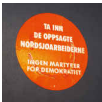
Klistermerke brukt i den opphetede debatten.

Men i OFS rådet ikke samme holdning. Her var forventningene til lønnsoppgjøret 1990 høye. Etter to år med lønnslov krevde arbeidstakerne noe igjen for moderasjonslinjen de hadde holdt