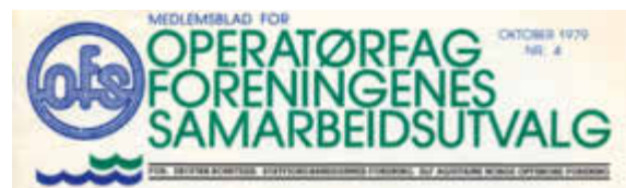
OFS skiftet navn flere ganger, men beholdt forkortelsen.

Etter å ha forsøkt løse allianser med flere andre forbund, kikket Ekofisk-komiteen til andre husforeninger på Statfjord og Frigg. I 1977 bestemte de tre foreningene seg for å opprette et samarbeidsutvalg, et forum hvor tillitsvalgte kunne treffes og utveksle meninger og synspunkt – men uten beslutningsmyndighet eller vedtekter. Mot slutten av året ble det utviklet mer bindende, formelle vedtekter, og sammenslutningen fikk navnet Operatørfagforeningenes samarbeidsutvalg – OFS. Det var en frittstående fagforening uten tilknytning til LO eller andre hovedorganisasjoner, snarere etablert som en motsetning