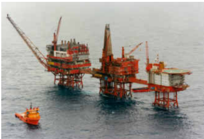
Valhall i tidlig fase av feltets utvikling.

Dette var et system som underminerte fellesskap og solidaritet. Konglomeratet av selskap og organisasjonsmønstre var uoversiktlig og oppstykket og gjorde solidariteten mellom yrkesgrupper avgrenset.