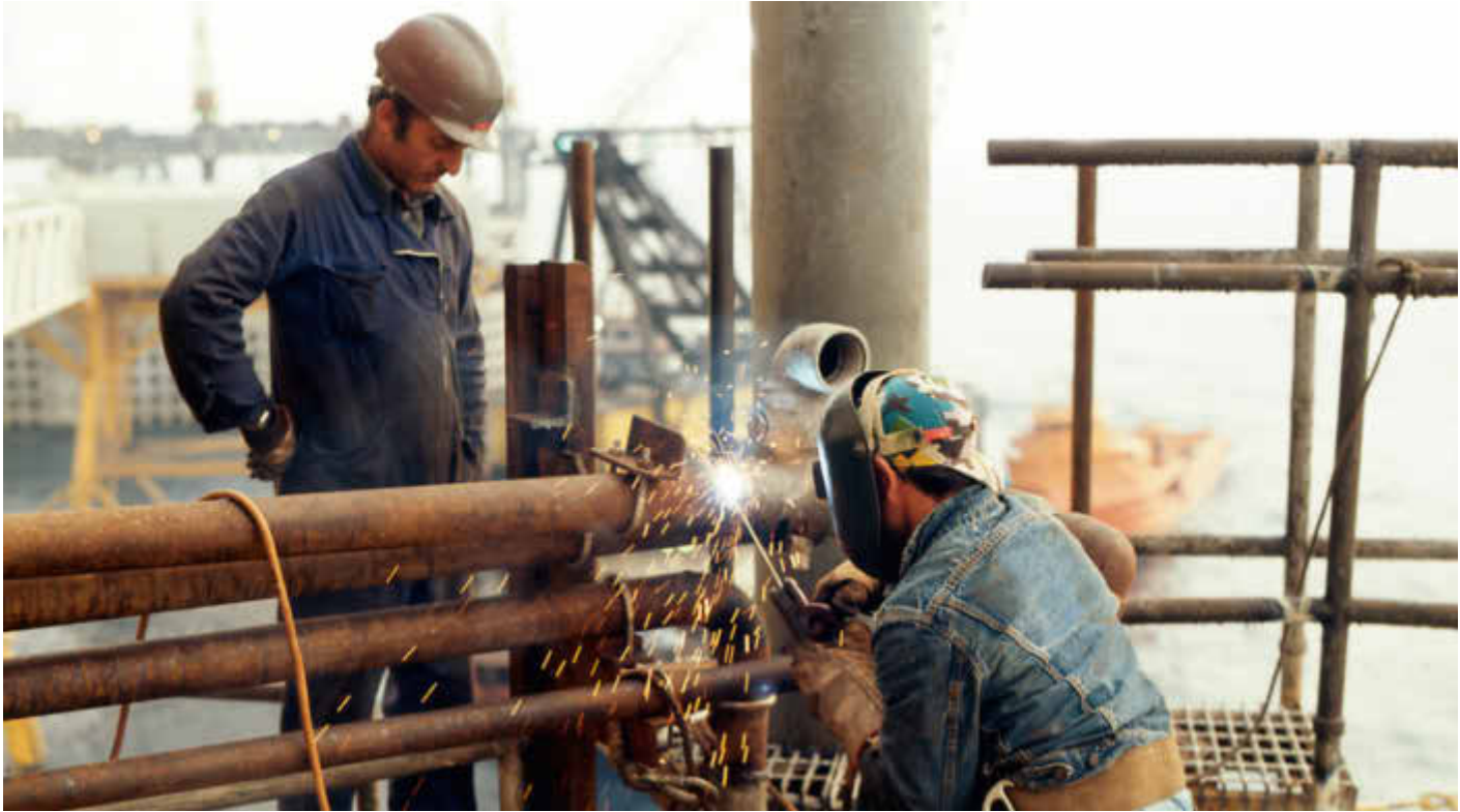
Sveising og vedlikehold på Valhall QP.

under foregående oppgjør. På grunnplanen i OFS rådet en holdning for å gjenta opplegget fra 1981 med å streike seg til bedre vilkår - om så streiken var ulovlig.