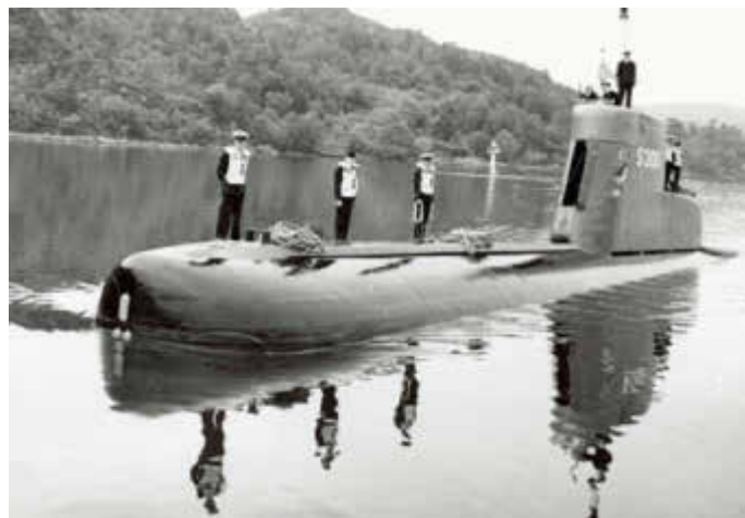
Slik ser den norske ubåten Kobben ut.

Vakthavende ved Stavanger politikammer reagerte som han skulle da de ringte fra overvåkings- og detektivbyrået Safety. Han slo nummeret til Sjøforsvaret og gjenfortalte det vaktmannen hadde sagt: Det var observert en ubåt i nærheten av oljeinstallasjonene i Gandsfjorden.