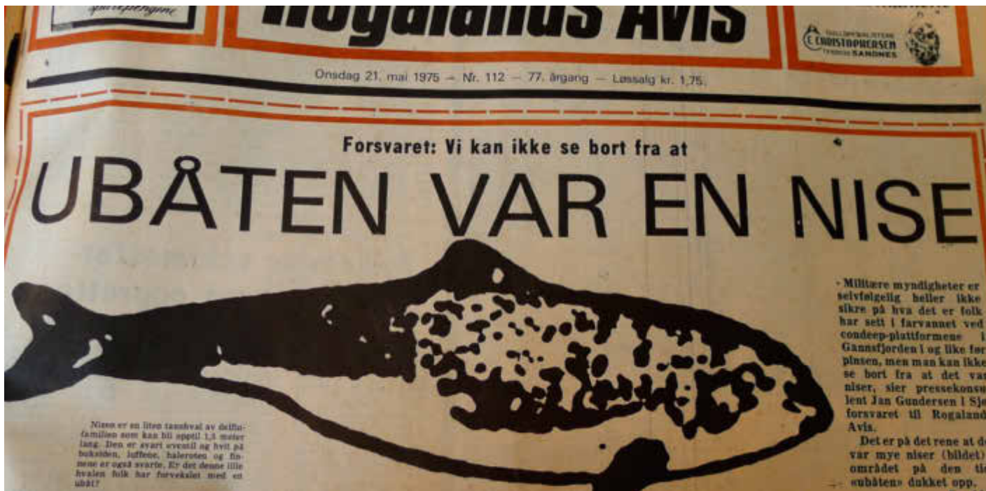
Sjøforsvarets pressetalsmann kunne ikke se bort fra at ubåten hadde vært en nise. (Rogalands Avis 21. mai 1975.)