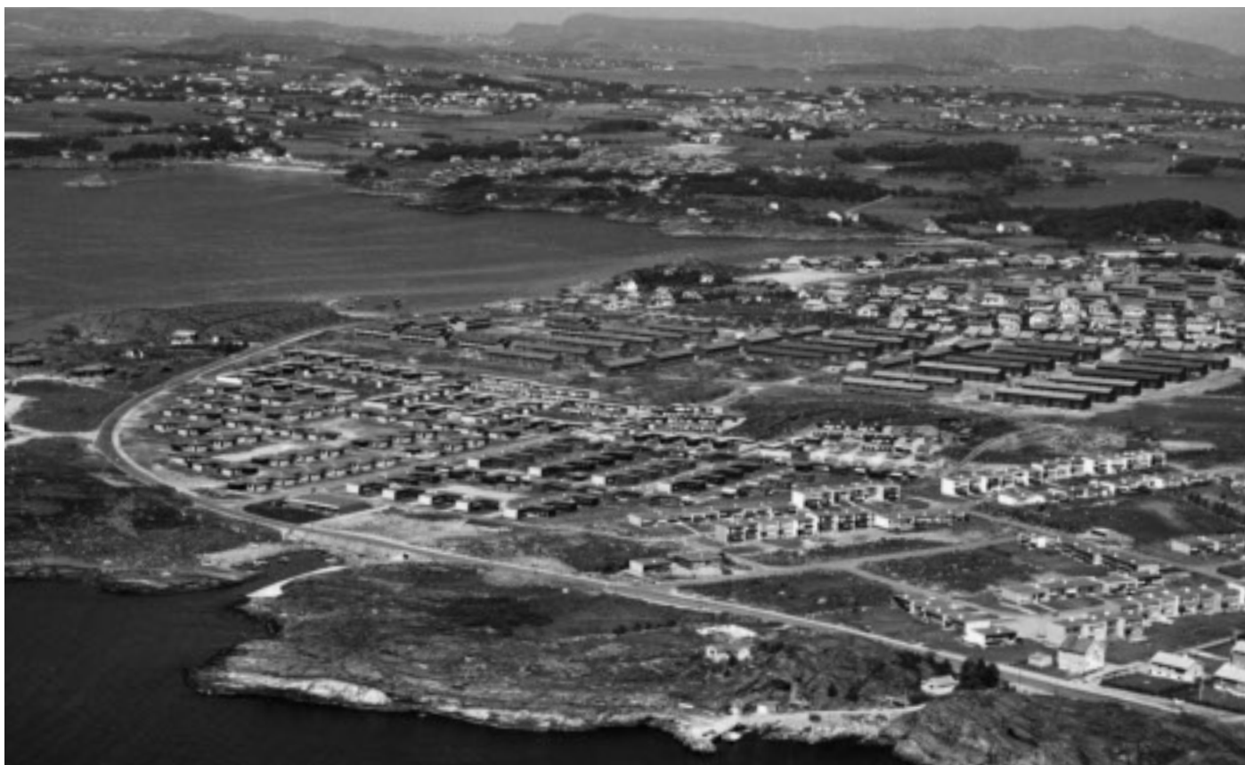
Flyfoto som viser utbyggingen av den nye bydelen i Kvernevik.

Hinna og Gausel/Godeset/Jåttå. I gamle Stavanger ble det bygd i Godalen og i Rosenli. Alle steder var det behov for å kople boligbyggingen til videre tilrettelegging av samferdsel, skole og andre offentlige tilbud. Industri og annen næringsvirksomhet skulle få sine egne områder.