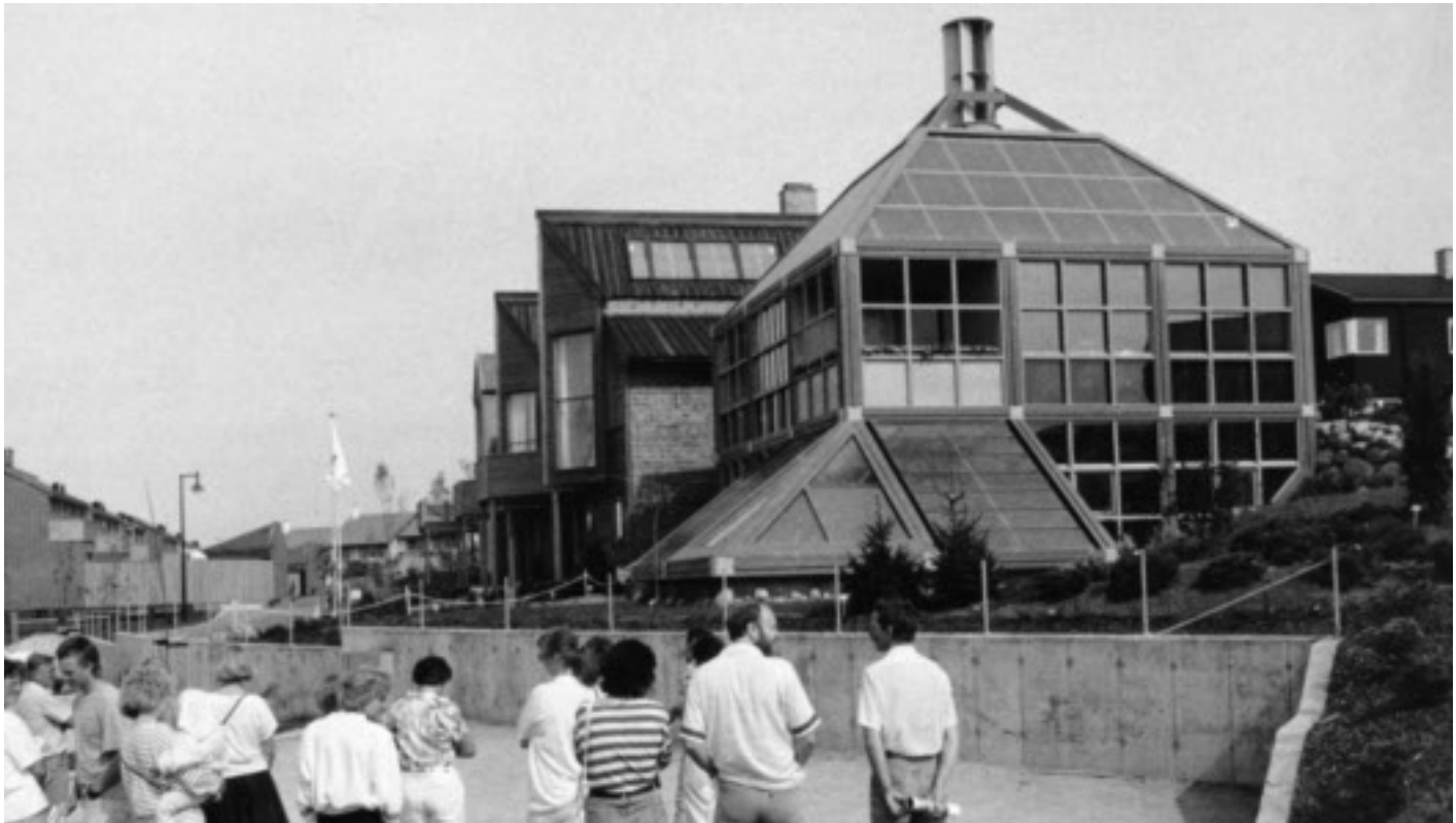
Eksperimethusene i prosjektet "Bygg for fremtiden" på Godeset.

arbeiderbevegelsen hadde det foregått en avideologisering og banalisering av gamle sosialistiske verdier. Det var ikke lett å holde «sin sti ren» innenfor et liberalistisk, økonomisk system som ensidig appellerte til egeninteressen. En uheldig praksis med «penger under bordet» og andre tvilsomme midler for å komme seg inn i et borettslag eller over i «det frie marked» ga nye argumenter til de politikerne som ville avvikle reguleringssystemet i boligsamvirket.