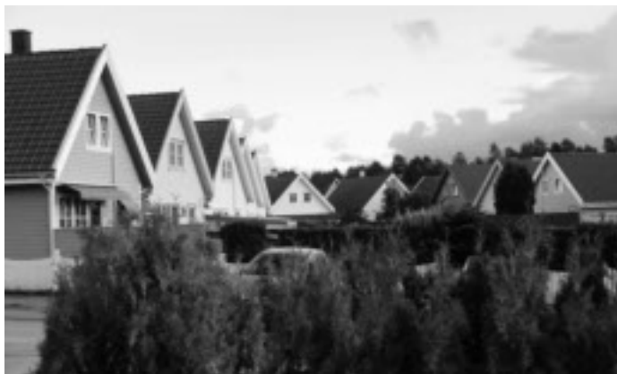
Ny boligbygging på Tasta. Det meste av utbyggingen her skjedde i regi av private entreprenører.

Det var fortsatt tomtmangel og høyt prisnivå ved både kjøp og leie. Prisene på boliger og leiligheter steg raskere i Stavanger enn andre steder i landet. Dessuten var det strenge, statlige utlånsrestriksjoner.