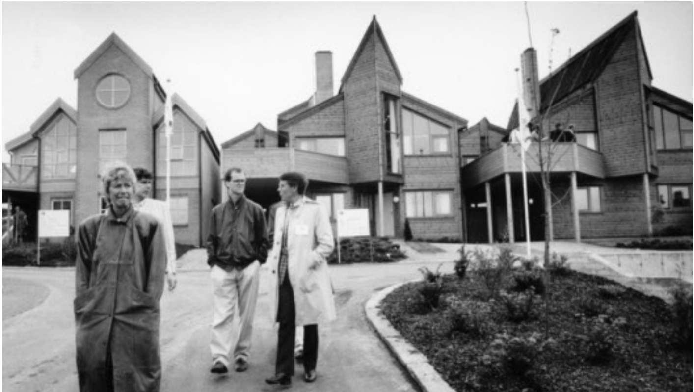
"Bygg for fremtiden" på Godeset.

Dette avspeilte den generelle samfunnsutviklingen, men i de senere år har mange nye beboere fått økt interesse for de sosiale og kontaktskapende sidene ved dugnad. En gryende motkultur blomstrer midt i det materialistiske forbrukersamfunnet.