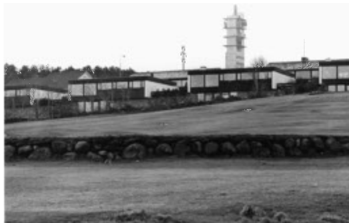
Mor Åses vei med Ullandhaugtårnet bak.

Det meste av boligområdene i Kvernevik og Sunde ble utbygd fram mot 1980. I 1983 ble Smiodden skole reist, og året etter fikk Sunde menighet (fra 1979) sin egen kirke. I 1986 kunne Kvernevikhallen tas i bruk. Folk søkte til kirken, skolen og idrettshallen, men da et nytt kjøpesenter, Kverntorget, omsider ble anlagt sentralt i bydelen, ble det en fiasko. Det hjalp ikke at bygget fikk en ganske dristig arkitektonisk utforming. Etter en tid ble kjøpesenteret fra-