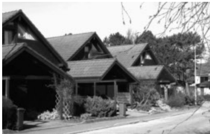
Orrestien.