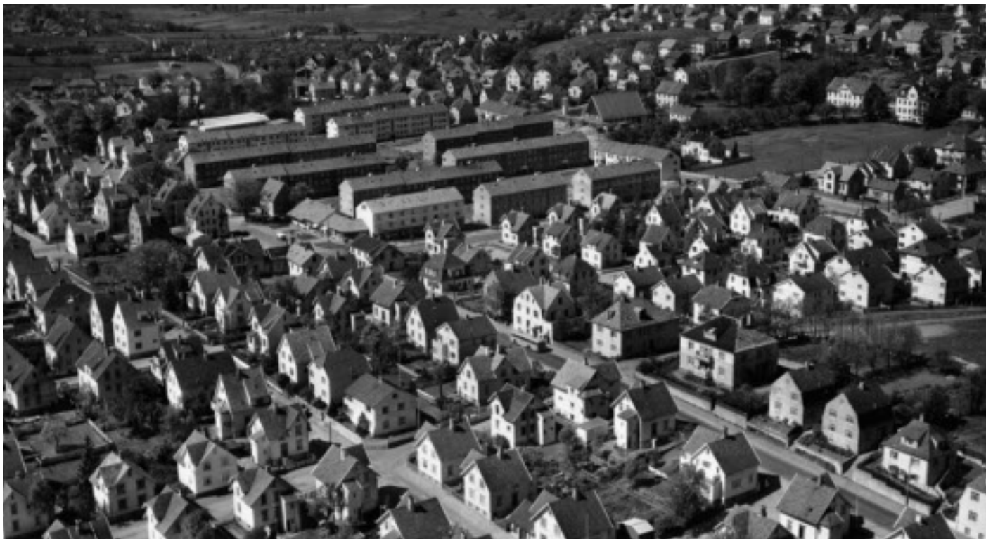
Blokkene mellom Stokkaveien og Seehusens gate, populært kalt Misjonsblokkene.