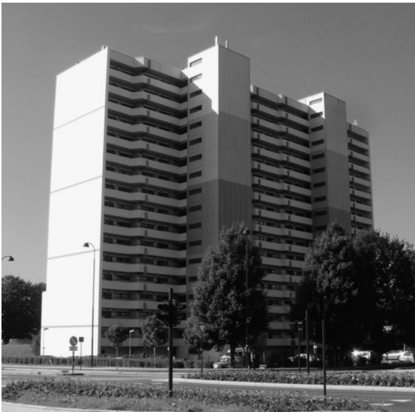
Blokka på Kristianslyst.