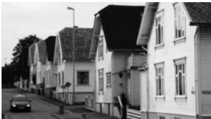
Horisontaldelte tomannsboliger på Våland.

Samtidig med dette prosjektet fikk også Stavanger Boligbyggelag klarsignal for å gå i høyden i sin utbygging i Rosenli. De opprinnelige planene for dette området ble endret underveis, og det endte med at boligbyggelaget i 1969 fikk bygge flere lavblokker på fire etasjer og to høyblokker på henholdsvis 16 og 17 etasjer. Den ene var ved innflyttingen i 1971 landets høyeste.