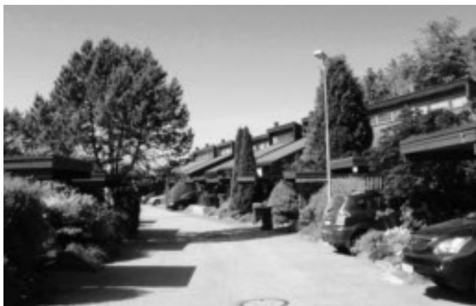
Sandal øst:

Madla Handelslag planla tidlig et butikkutsalgsalg i Kvernevik. Her åpnet laget motvillig, av konkurransehensyn, for ølsalg i 1971. Men i hovedutsalget i Madlakrossen gjaldt forbud mot ølsalg helt fram til 1979. Da innså også de mest avholdende medlemmene at det var nytteløst å stå imot den omsegggripende bykulturen.