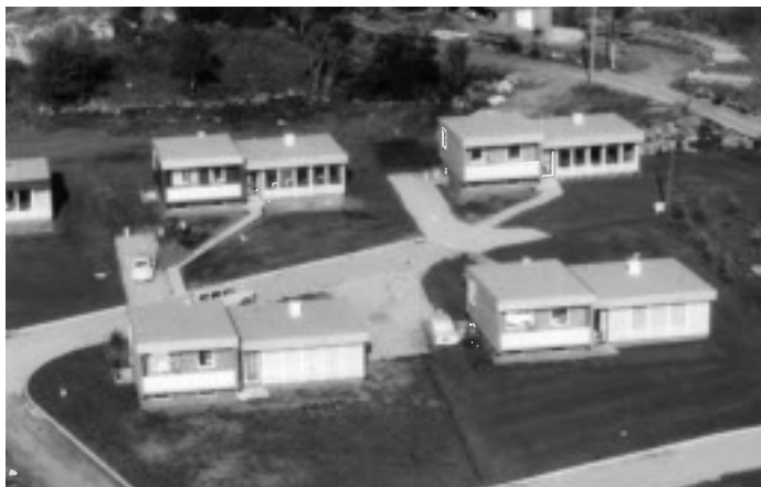
Olafshagen: Foto: Bate boligbyggelag

Kvernevik ble lenge liggende som en utfordrende urban øy i et gammelt landbruksområde. De første årene skapte mangel på aktivitetstilbud og møtelokaler problemer med enkelte ungdomsgjenger. Den lange veien til byen og alle