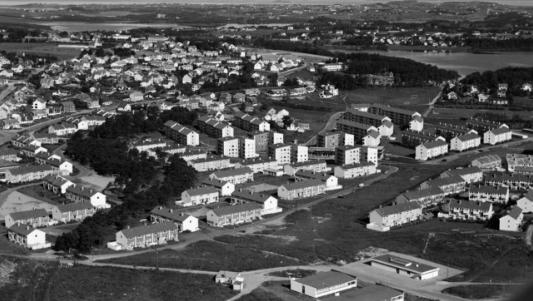
Stavanger Boligbyggelags utbygging på Saxemarka, Solsletta og Solhøgda. Vi ser også traseen som er regulert til Motorveien.

I en utredning til bystyret i februar 1966 kunne teknisk rådmann melde at boligbehovet ville øke hurtigere enn befolkningstilveksten, fordi de store barnekullene fra slutten av 1940-årene nå meldte seg på boligmarkedet med krav om større boligareal. Det ble også regnet med flere hushold med få eller enslige personer i kommende år.