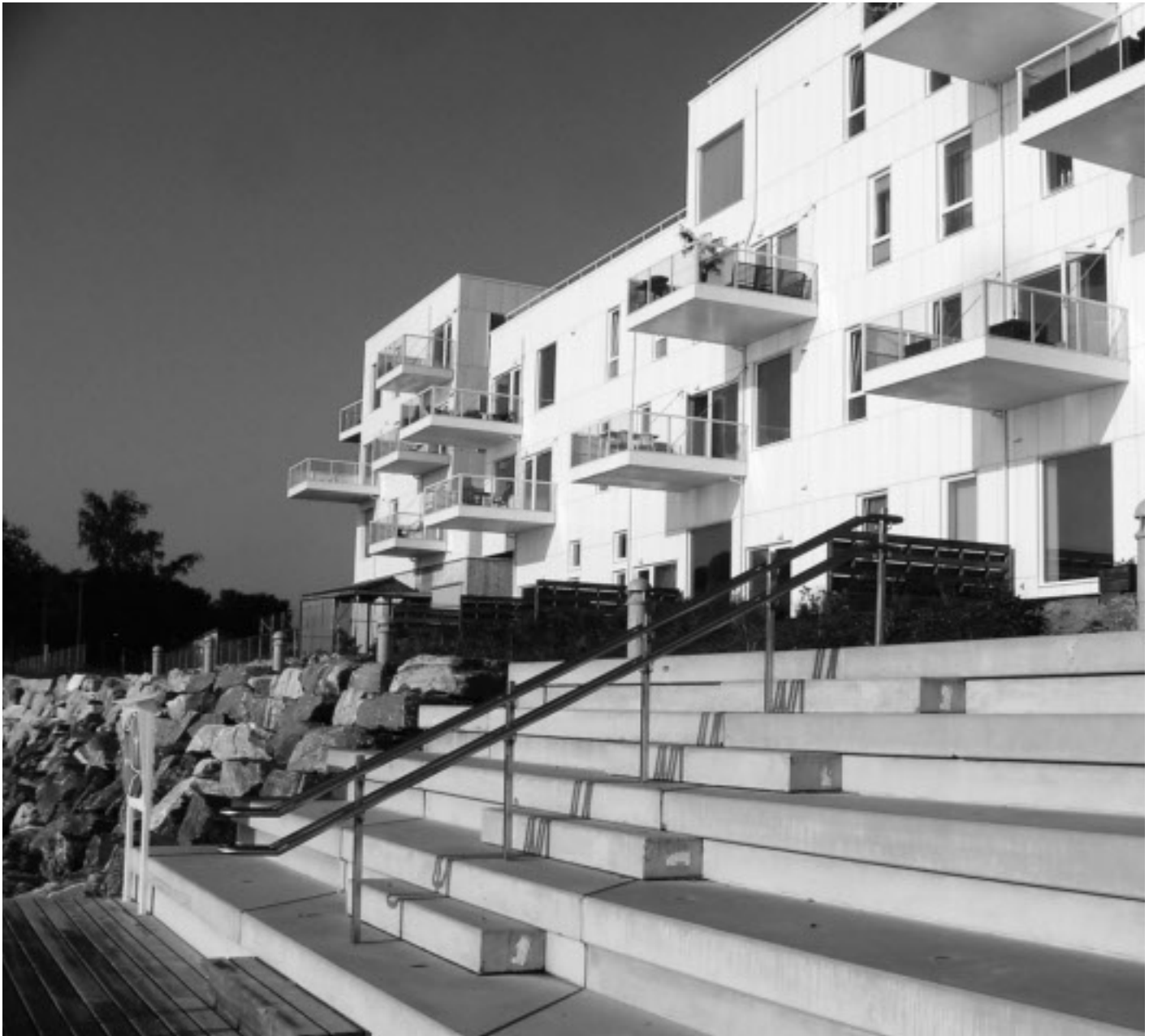
Ny boligdyll ved Breivig båthavn.