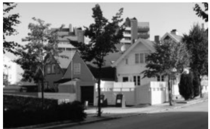
Den gamle bebyggelsen på Ramslandsberget fikk stå i fred.