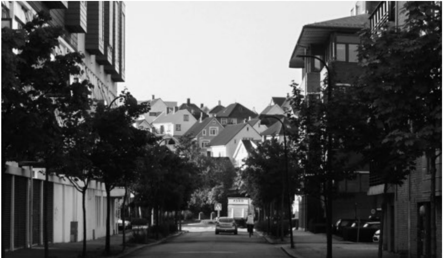
Verven mot Storhaug