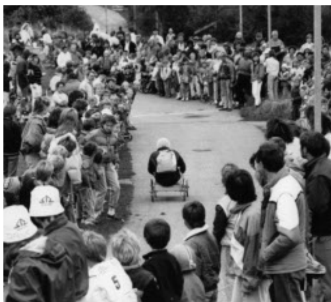
Haugtussa 1987.