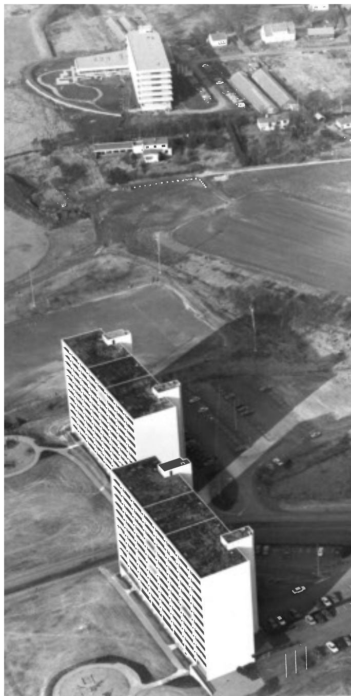
Lassablokkene, Stokka sykehjem i bakgrunnen.

Dette gjorde det også aktuelt å bygge høyhus sentralt i byen. Tanken om å sanere eldre boligstrøk ble først realisert ved den høyblokken som ble bygd over en ny