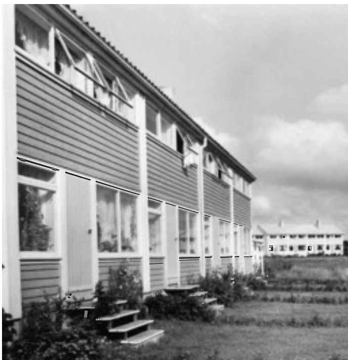
Fra Bekkefaret.