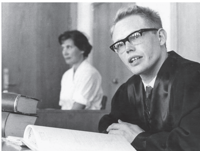
Den prosederende advokat. Fra 1962.

- Min farfar var bonde, offiser og ordfører for Venstre i Ullensaker. Senere ble han amtsordfører i Akershus. Han markerte seg som radikal republikaner i tiden omkring unionsoppløsningen 1905. Bestefar skal ha vært en meget bestemt mann også hjemme, og barna fikk en streng oppdragelse. Blant dem var min far, som ble født i 1897. Etter landbruksskole og krigsskole tok han fatt på jusstudiet ved Universitetet i Oslo.