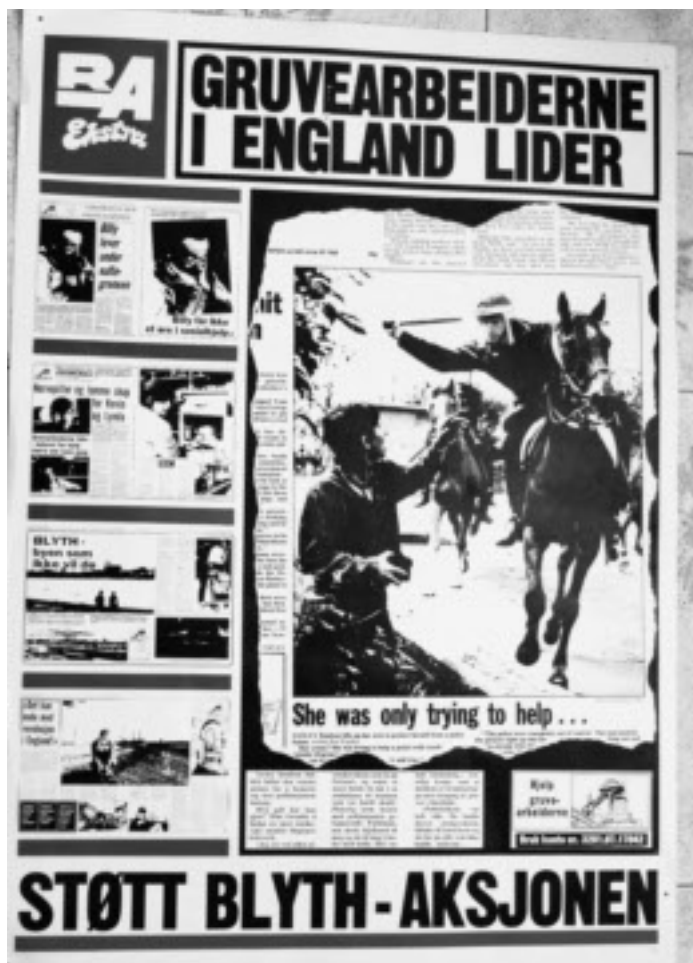
Plakat som Blyth-aksjonen i Stavanger fikk laget i 1984.

Andre ganger viste de oss sine tomme kjøkkenskap og sine ubetalte regninger. De snakket om ydmykelse, sult og nervepiller. Den lille sosialstøtten de fikk, gikk til dekning av faste utgifter som strøm, gass og vann. Det var ingen penger igjen til mat når regningene var betalt. Hele