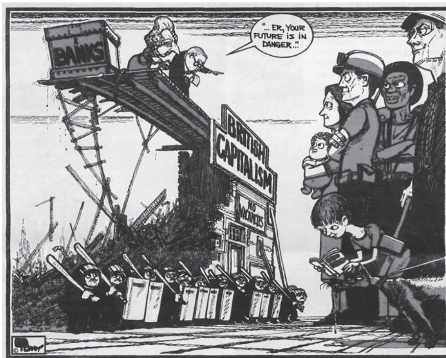
«Deres framtid er i fare!» roper statsminister Margaret Thatcher og gruveselskapets leder Ian MacGregor til gruvearbeiderne. De skulle få rett i sin advarsel. Tegning fra The Mineworker .

En hær av politifolk ble satt inn mot gruvearbeidernes streikevakter. Det ble utkjempet regelrette gateslag, der flere gruvearbeidere ble drept og mange tusen etter hvert ble skadet. Regjeringen var tydeligvis villig til å bruke ubegrensede ressurser for å knuse gruvearbeiderne og deres mektige fagforbund. I ettertid er det antydning at det gikk med 6 milliarder pund på å beseire gruvearbeiderne og ytterligere 26 milliarder på å ødelegge gruveindustrien i etterkant. «...the Tories prepared for this battle «just like